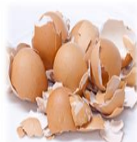
Cáscaras de huevo