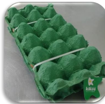
Bandeja X15 un amarrado

En esta presentación se comercializa huevo AA y A