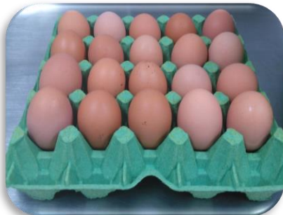
Bandeja X20 un suelto

En esta presentación se comercializa huevo Jumbo