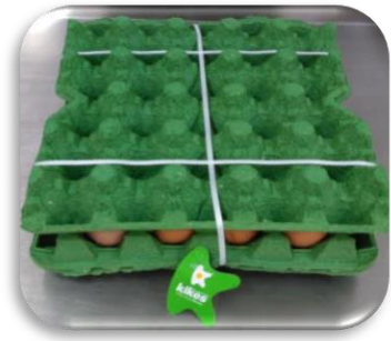
Bandeja X20 un amarrado