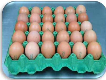
Bandeja X30 un suelto

En esta presentación se comercializa huevo AAA, AA, A y B