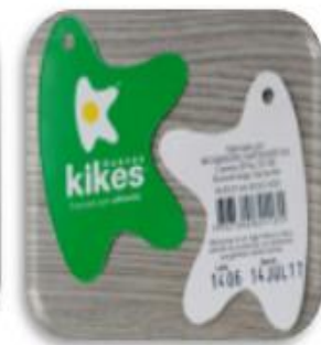
Etiqueta de cartón