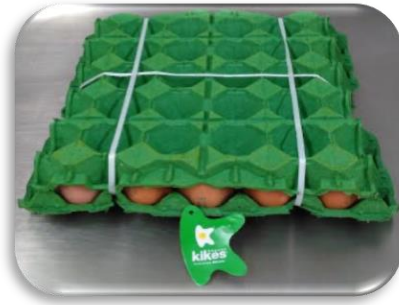
Bandeja X30 un amarrado