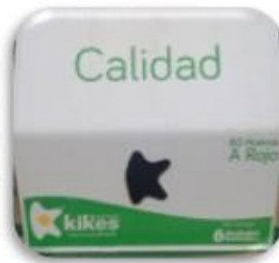
Cajas de cartón